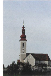
Pfarrkirche St. Oswald